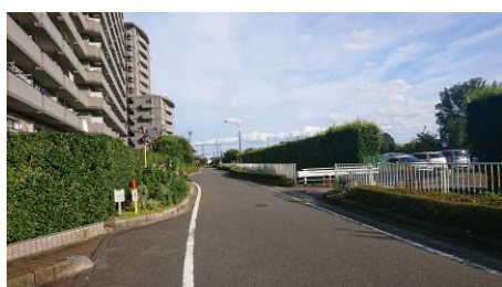
外周道路は緊急車両の侵入・活動帯です

去る6月上旬にD棟居住者から救急車が要請されました。消防では救急車に先駆けてレスキュー隊を出動させましたが、当マンション南西側の外周道路に駐車車両があり車両の進行が極めて困難な状況で、到着に遅延を来すこととなりました。