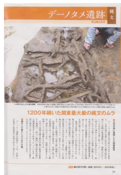
発掘された日本列島 2021

その後、4度の発掘調査が行われ、関東最大級の環状集落を持つ遺跡であること、集落と水辺がセットで残された全国でもまれな遺跡であること、縄文人の植物利用の実態が解明できる遺跡であることなどが分かってきました。現在、北本市は遺跡の保存も検討しています。デーノタメ遺跡の総括報告書はホームページに掲載されています。