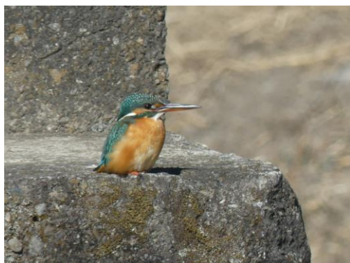
赤堀川のカワセミ