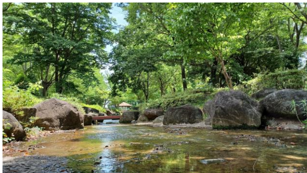
北本市総合公園「親水広場」