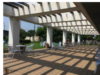
吉見の管理事務所 サイクリストの溜り場 になっています。

埼玉県のサイクリングロードとして最も知られているルートの1つです。当マンションからは北本氷川神社入り口から、高尾スポーツ広場を目指して荒川の河川敷に出ます。河川敷に出たら、鴻巣側に進みます。途中で有名な鴻巣のポピー畑があります。この河川敷は車も走り路面もあまり良くありませんが、御成橋を過ぎた後、斜め右に進み、坂道を上ると荒川の堤に出ます。ここからが、一般車両の通らないサイクリングロードです。荒川のサイクリングロードは右岸（西側）が良く取り上げられていますが、左岸（東側）の方が道が広く、視界も良く、殆ど平坦ですので走りやすいと思います。7~8kmほど進むと、吹上総合運動場があります。トイレ、自動販売機のほかベンチが沢山ありますので休憩場所に良いと思います。ここで折り返しても良いですが、その先の大芦橋を渡り右岸のサイクリングロードで北本に帰るのも良いでしょう。右岸は自転車専用ロードですが道幅はあまり広くありません。また、路面も少しでこぼこしています。帰りの休憩場所は吉見総合運動公園の管理事務所がお勧めです。ロードバイクを停める設備もあり、水筒用の氷もただで提供してくれます。さらに進み荒井橋を渡ってマンションまで戻ると約30kmのサイクリングとなります。