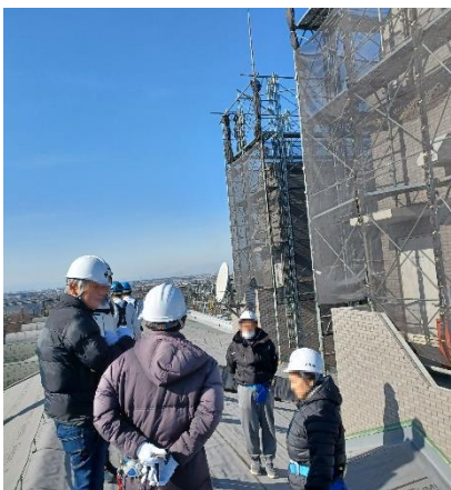
足場解体前検査の様子

第 2 回大規模修繕工事は順調に進んでおり、A 棟、B 棟、C 棟、AN 棟、管理棟の 7 月 18 日時点の工事進捗率は 92%であり、予定（73%）より大幅に早く進んでいます。D 棟、E 棟、F 棟、G 棟の進捗率は 76.0%であり、こちらも予定（71.8%）より若干早く進んでいます。